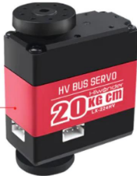
LX - 224 HV Servo

Крутящий момент: 20 кг*см. Материал вала и шестерней: Алюминий